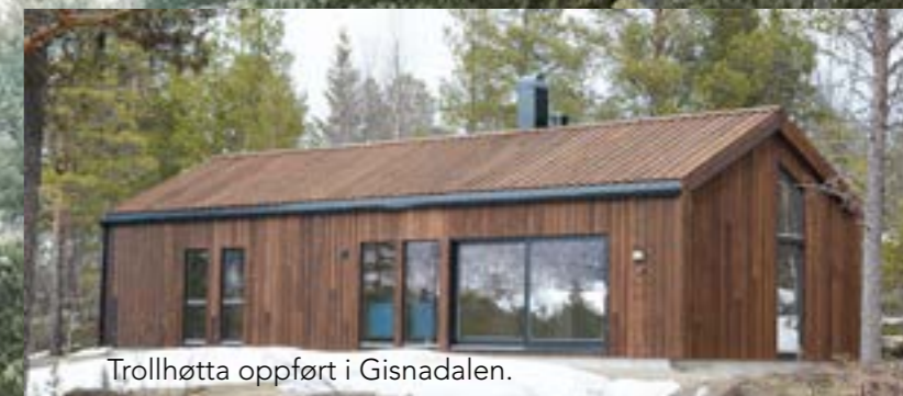
Trollhøtta oppført i Gisdalen.